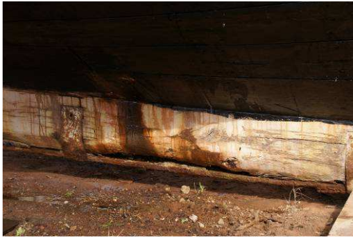
La bande molle est vraiment très mal en point !