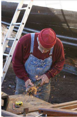
Usinage sur mesure