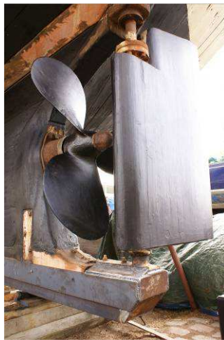
Talon tout neuf