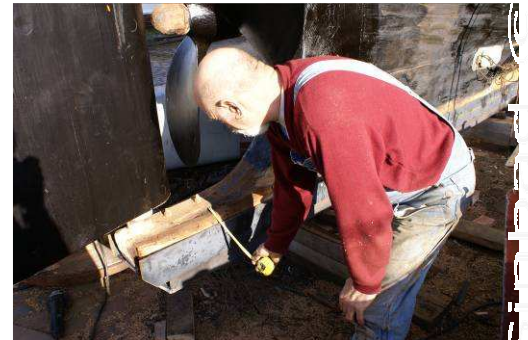
Voyons Sinbad, quelle est ta peinture ?