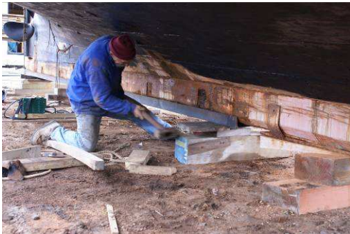
Mise en place d'un fer de quille