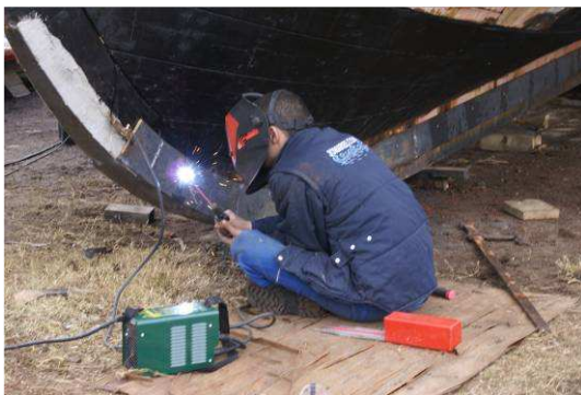
Soudure en forme du brion